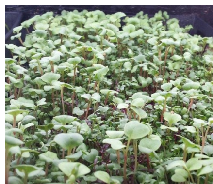
Micropousses / 8 jours