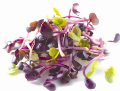
Germes / 5 jours